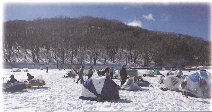
(上) 氷上の穴釣り (左) 筒型ふ化器 (右) 発眼卵とふ化仔魚