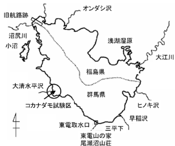
図1 尾瀬沼コカナダモ試験区位置図

矢島久美子：コカナダモの生育条件に関する研究（第2報）光合成速度に及ぼす照度、温度の影響、群馬県衛生公害研究所年報、1987；19：109-113.