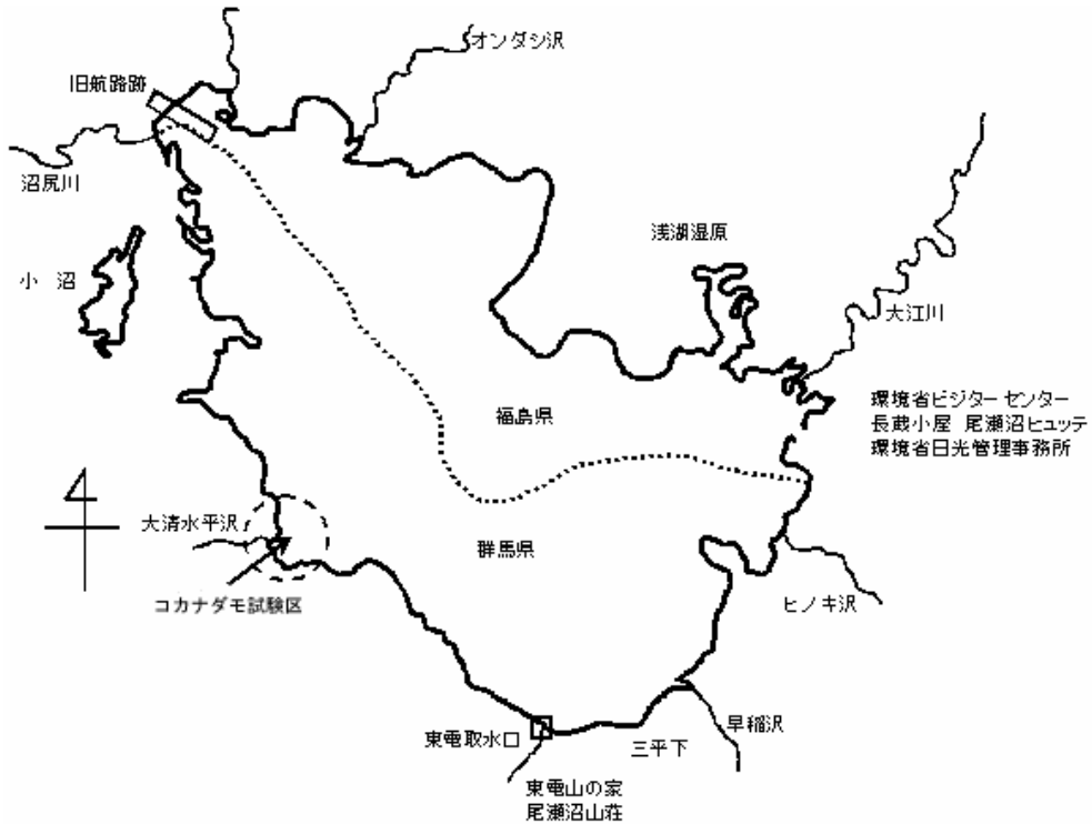
図1 尾瀬沼コカナダモ試験区位置図

る研究(第2報)光合成速度に及ぼす照度、 温度の影響、群馬県衛生公害研究所年報、 19、109～113、1987.