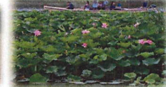
渡し舟が起源 花ハスクルーズ