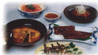
沼の幸・川魚料理