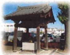
龍神伝説の竜の井