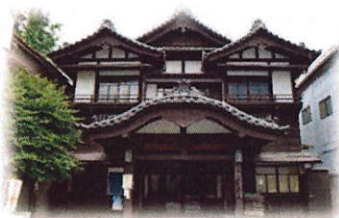
旧館林二業見番組合事務所