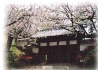
館林城三の丸土橋門