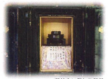
茂林寺に伝わる茶釜