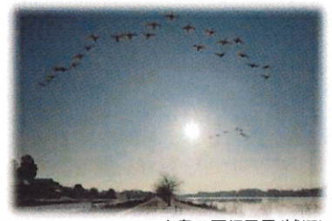
白鳥の雁行風景(城沼)

❖多々良沼とその沼辺に細長く連なる松林。そこには「たたら」の地名の由来となった古い時代の製鉄の痕跡と、500年前の開拓者大谷保泊による植林と用水堀開削の歴史が刻まれている。多々良沼は、人々の暮らしを支え