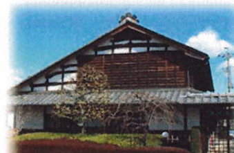
正田醤油正田記念館