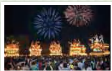
鬼石夏祭り ONISHI NATSU MATSURI 山車を引っ張り坂を駆け上がる「新田坂の駆け上がり」と5台の山車が一堂に会する「寄り合い」は迫力満点です。 所在地 藤岡市鬼石 市街地