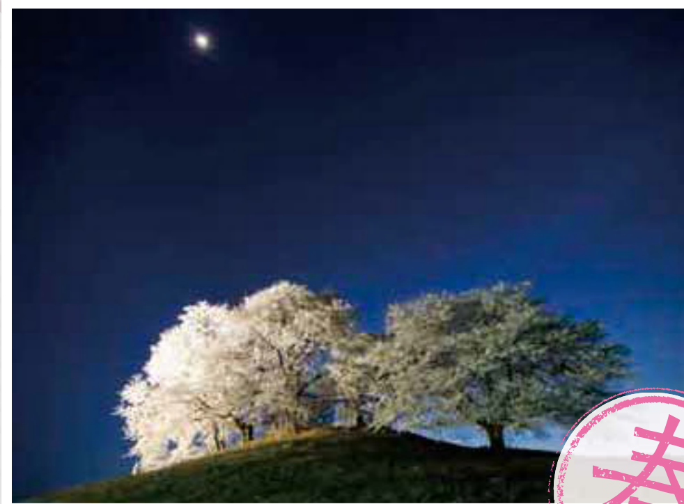
白石稲荷山古墳 SHIROISHI INARIYAMA KOFUN 古墳の頂上に数本の桜の木があり、満開になると、巨大な一本に見える見応えある桜です。 所在地 藤岡市白石1365