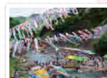
かんな鯉のぼり祭り KANNA KOINBORI MATSURI 会場近く、こいこい橋より撮影した、鯉のぼり祭りの全容がみられる一枚。 所在地 神流町こいこい橋