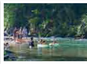
神流川 KANNA GAWA 川魚が見えるほどの清流「神流川」。中でもおすすめは役場下の河川敷。それと神流川支流の北沢の渓谷美もきれいです。 所在地 多野郡上野村