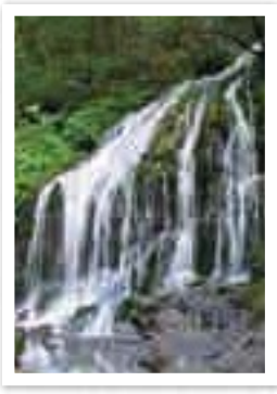
白水の滝 SHIROMIZU NO TAKI 白い糸が流れているようなことから白水の滝と呼ばれています。車でのアクセスができますので、ぜひ、お立ち寄りください。 所在地 多野郡神流町魚尾