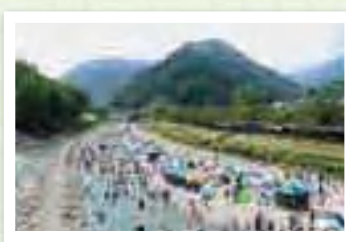
神流の涼 KANNA NO RYO 河川敷に並ぶいくつものテントは、真夏の海水浴場を思わせる風景です。 所在地 多野郡神流町こいこい橋下