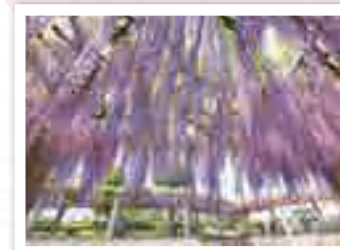
藤岡ふじまつり FUJIOKA FUJIMATSURI 4月下旬から5月上旬開催。開催期間中、夜間はライトアップされ、幻想的なムードに包まれた藤の花が楽しめます。 所在地 藤岡市藤岡2690-7