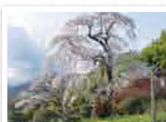
龍松寺しだれ桜 RYUSUJOI SHIDAREZAKURA 日本の春を感じさせる桜。龍松寺のしだれ桜は古風な趣を放ちます。 所在地 多野郡神流町塩沢