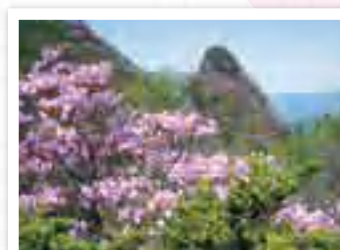
笠丸山・天狗岩 KASAMARU YAMA/TENGUIWA ヤシオツツジが山頂に咲き誇り、5月の連休付近には山頂がピンク色になるほど。 所在地 多野郡上野村乙父