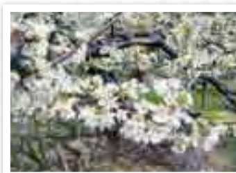
プラムの花 PLUM 4月下旬から見頃で、道の駅周辺の遊歩道やまほ一ぱの森から見ると山一面に白い花を眺めることができます。 所在地 多野郡上野村勝山