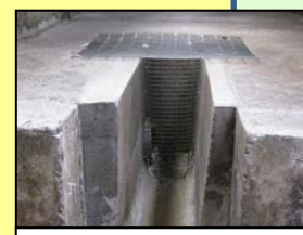
排水溝等からの 侵入防止対策 (鉄格子の設置)