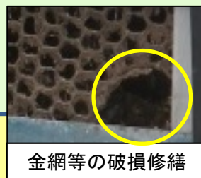
金網等の破損修繕