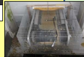
集卵・除糞ベルトの開口部の隙間対策