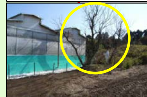
家きん舎周囲の樹木の剪定