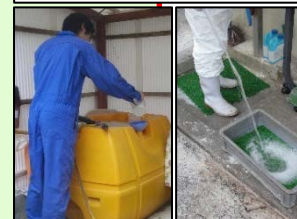
消毒液の定期的交換