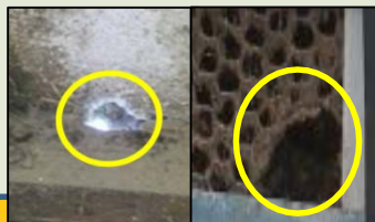
壁や金網の破損修繕