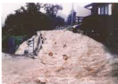
被害状況(平成13年8月)