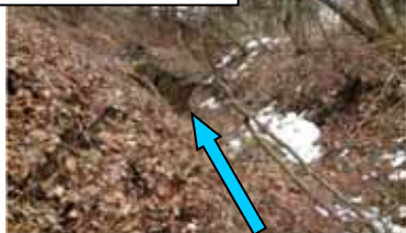
堰堤下流荒廃状況