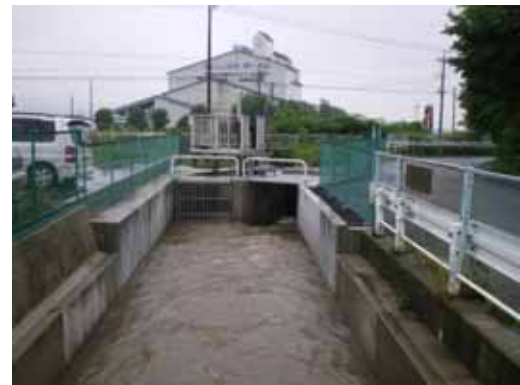
岡登用水路(整備後)