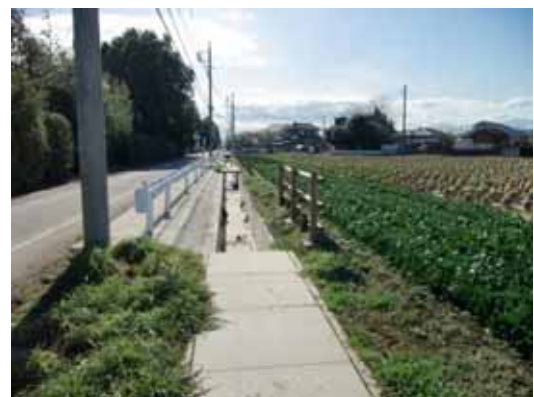
長堀支線直接排水路(整備後)