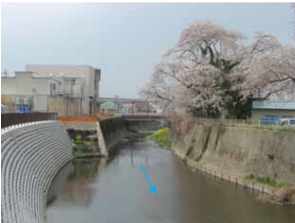
河道拡幅による流下断面の確保