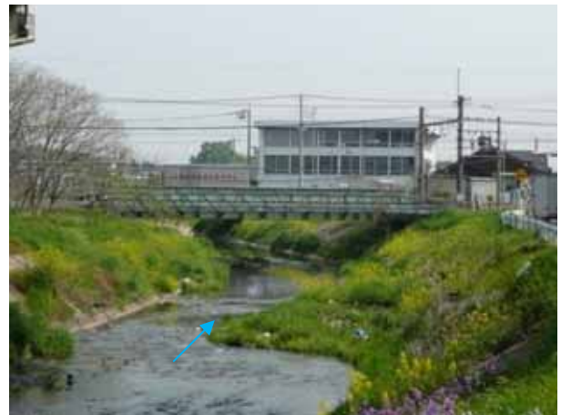
河床掘削による流下断面の確保を予定