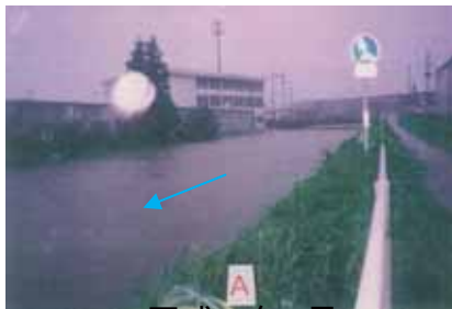
平成11年8月 出水状況

断面狭小による流下能力不足により浸水被害が頻発していたため、過去に河道改修を行ったが、近年、流域内の都市化が急速に進んだことにより、再び事業所や家屋の浸水被害が発生している状況である。このため、河道改修により流下能力を向上させ、流域内における浸水被害の軽減を図ることを目的としている。