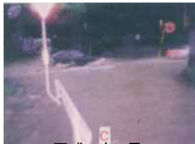
平成10年9月 出水状況