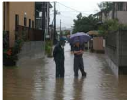
平成19年9月の台風による出水と浸水状況