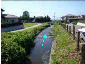
断面狭小(区画整理事業内)

また、竜の口川上流においては土地区画整理事業などの開発が行われ、近年急激に市街化が進んでいることから、河道の拡幅による護岸整備により、沿川地域の氾濫被害を防除するとともに、沿川地域からの流出増に対しても十分対応できるよう治水安全度を高めることを目的としている。