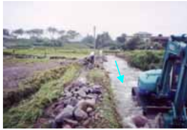
豪雨による氾濫状況