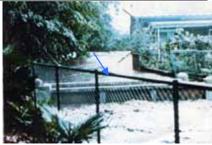
豪雨による氾濫状況