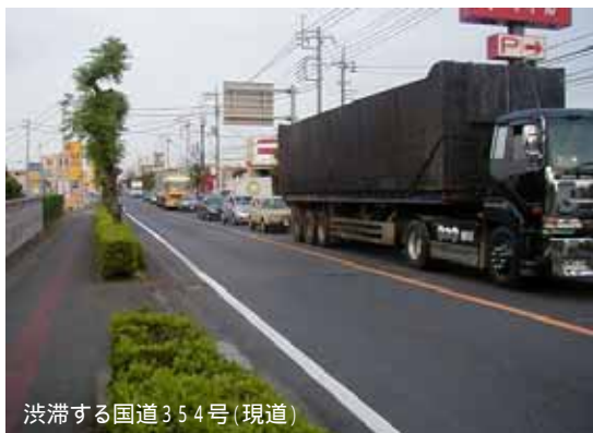
渋滞する国道354号(現道)