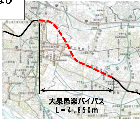
大泉邑楽バイパス L = 4,850m