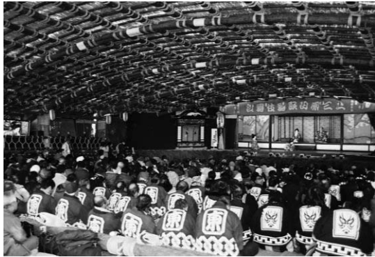
上三原田の歌舞伎舞台