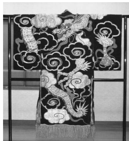
横室の歌舞伎衣装

工芸品は、5割以上が刀剣類で、その他には寺院や神社に伝えられてきた梵鐘等がある。刀剣は大半が個人所有であるが、梵鐘等は寺社が所有し、多くは現在でも使用されている。特筆すべきは江戸時代の横室の歌舞伎衣装（前橋市 県重文）で、天保年間（1830年～1843年）以前の豪華な衣装が保存されている。近隣の村落に貸し出していた記録も残っており、当時の農村歌舞伎の盛況ぶりをうかがうことのできる貴重な資料である。