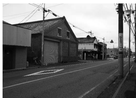
桐生市桐生新町重要伝統的建造物群保存地区