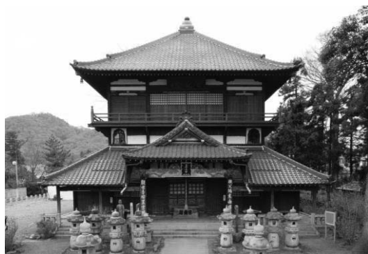
曹源寺栄螺堂（太田市）

指定・登録を受けている建造物や史跡・名勝・天然記念物については、所有者や管理団体に対し、確実な保存と効果的な活用を見据え、周辺の環境や景観とあわせた保護策の検討を促していく。特に世界遺産「富岡製糸場と絹産業遺産群」についてはその価値を損なわないために緩衝地帯を確保することが求められており、それぞれの資産において適切な保護の対策が取れるよう支援していく。