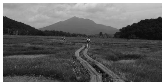
特別天然記念物 尾瀬

特別天然記念物の尾瀬（片品村）は本州最大の湿原である尾瀬ヶ原を有し、希少な自然を間近に楽しむことができる。観光資源として注目され、過剰利用が問題となったこともあったが、様々な取組によって貴重な自然環境を守っている。