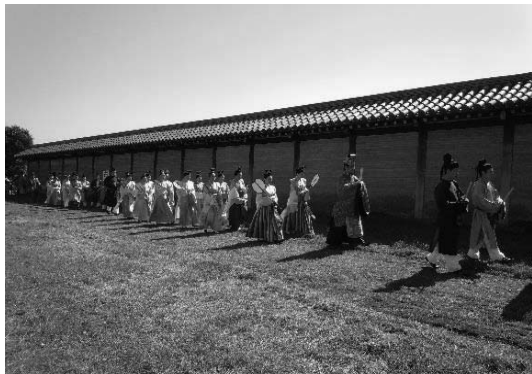
上野国分寺まつり

国指定の史跡では、比較的公有地化や整備が進んでおり、史跡公園として県民に親しまれているものも多い。整備が進んでいる史跡では、小中学校の校外学習等で利用されたり、近隣の博物館や観光施設と合わせた県外からのバスツアーで訪問したりする例もある。かみつけの里古墳祭りや、上野国分寺まつりのように、地元市町村や民間団体が主催する史跡地を活用した催しも行われ、例年多くの見学者が訪れている。草刈り等の日常管理に地元の住民が参加するなど、地域で史跡を守っていこうとする取組も見受けられる。改正文化財保護法でうたっている、地域総掛かりで文化財を継承していく取組であり、今後同様な維持管理体制の構築がますます必要となっている。