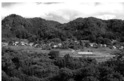
中之条町六合赤岩重要伝統的建造物群保存地区

養蚕農家が建ち並び養蚕を主産業とした山間の集落の姿を残す「中之条町六合赤岩 なかのじょうまちく にあかいわ 」と、多くの織物工場や店舗等の建造物が絹織物業を中心に発展した町の歴史を伝える「桐生市桐生新町 きりゅうしきりゅうしんまち 」が、国の重要伝統的建造物群に選定されている。いずれも群馬県の特徴である蚕糸業に関連する文化財であり、日本遺産「かかあ天下ーぐんまの絹物語ー」を構成する文化財にもなっている。