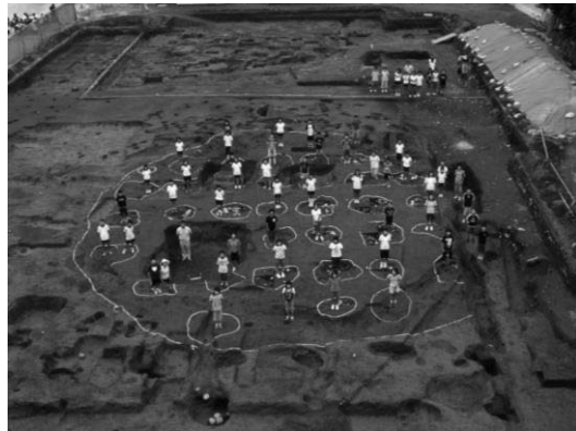
上野国佐位郡正倉跡の八角形倉庫跡