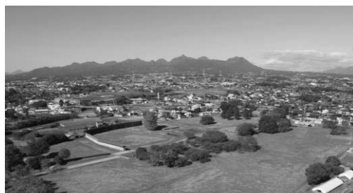
上野国分寺跡（遠景は榛名山）

このうち上野国分寺跡は、平成 24 年度（2012）から整備に向けた調査を行い、伽藍配置が従来の想定とは異なっていたことが判明するなどの成果が得られた。令和 2 年度には整備基本計画を策定し、その後整備事業に着手する予定であり、効果的な活用方法を検討していく。