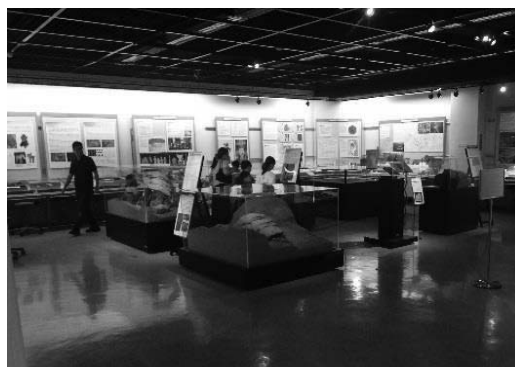
群馬県埋蔵文化財調査センター発掘情報館