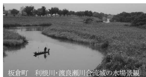
板倉町 利根川・渡良瀬川合流域の水場景観

板倉町の「利根川・渡良瀬川合流域の水場景観」が国の重要文化的景観に選定されている。これは、利根川と渡良瀬川の合流域に形成された「水場」と呼ばれる地域で、頻繁に水害に見舞われながら