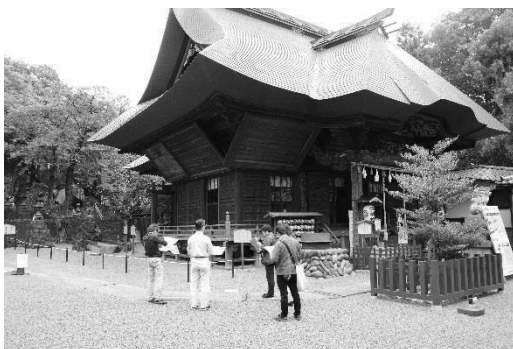
近世寺社調査（前橋市産泰神社）