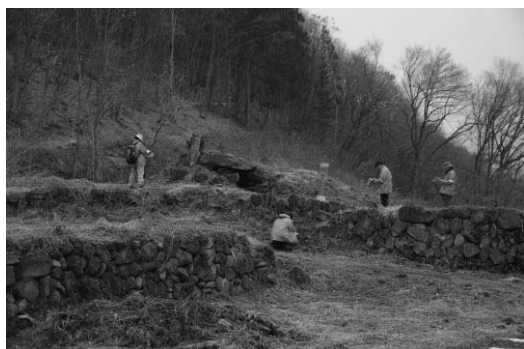
古墳総合調査（沼田市奈良古墳群）

今後は、県内の実態が不明確なため指定が進んでいない分野や、損壊や滅失の危険性が高くなっている文化財について、悉皆的な調査を行う必要がある。特に古文書や歴史資料、有形の民俗文化財、近代の養蚕農家等は危険性が高く、市町村や民間団体等と連携しながら計画的に実施していきたい。文化財保護審議会専門部会委員の調査とともに、外部の専門機関・専門家・大学等への調査委託も考慮し、短期的・中長期的な調査計画の立案と、それを遂行するための予算確保に努めていく。