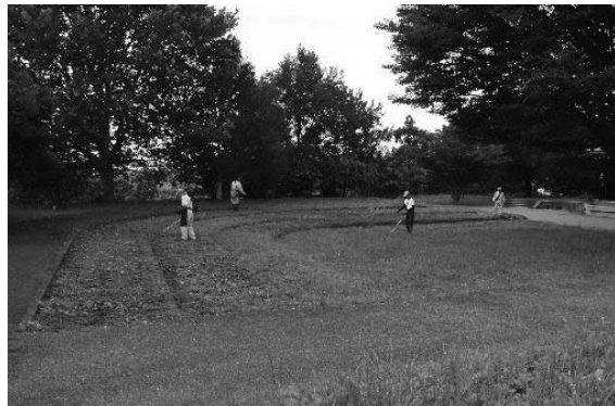
上野国分寺跡の住民ボランティアによる除草作業