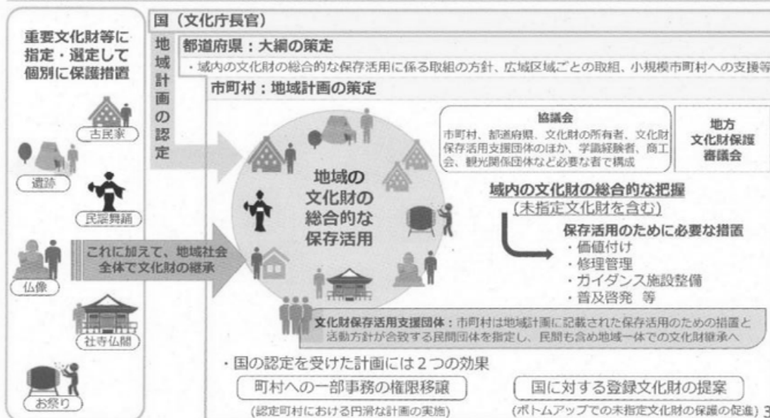
第1図 改正文化財保護法のイメージ

務については町村へも権限移譲ができることとなった。保存活用計画が認定を受けると、文化財所有者や管理団体は計画に基づく保存・管理を行う上での手続きを弾力化することが可能となるほか、一部の美術工芸品については一定の条件の下で相続税の納税が猶予される。この他、市町村は文化財保存活用支援団体を指定することにより、民間を含めた地域一体で文化財の適切な継承を目指すことが可能となった (第1図)。