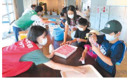
キラキラスライム作りの様子