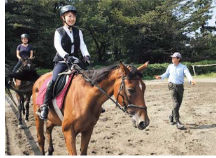
インストラクターが丁寧にサポートします