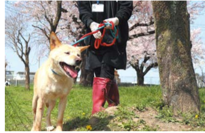
ボランティアに参加してみませんか