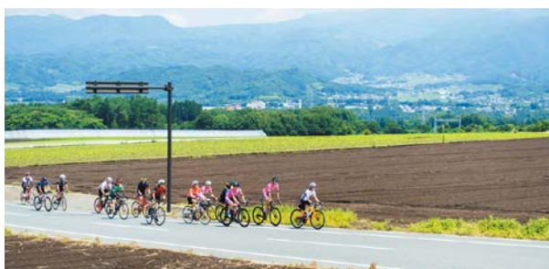
河岸段丘を駆け上がる