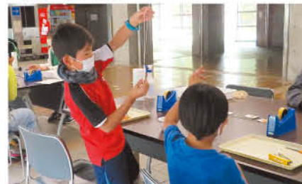
子ども向けの工作教室

日 1月8日(土)~10日(月) 午前10 時~正午、午後1時30分~4時30分 所 県生涯学習センター(前橋市文 京町) 定 各回60人 料 無料 申し込み方法 当日、会場へ直 他 工作教室などの子ども向けイ ントを同時開催 問 県生涯学習センター(☎027- 220-1876)