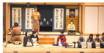
歌舞伎の世界をのぞいてみませんか

日・回 1月22日(土) ・午前の部(渋川子ども歌舞伎、ワ ークショップ)…午前10時30分か ら ・午後の部(県歌舞伎保存協議会に による歌舞伎)…午後1時30分か 定 各回200人先 料 無料 受 1月13日(木)まで 申し込み方法 往復はがき。往信面 に「伝統歌舞伎の祭典」、住所、氏 名、電話番号、希望の部(午前・午 後・終日)、返信面に住所、氏名を 記入してください 他 1通で1人まで 申・問 県教育文化事業団(☎37 1-0801 前橋市文京町2-20-22 ☎027-224-3960)