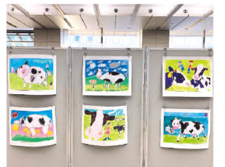
子どもたちが描いた元気あふれる絵

日 1月29日(土)~2月4日(金) 午前9時~午後5時 ※4日は2時まで 所 県庁(前橋市大手町) 問 県庁畜産課(☎027-226-3 103)