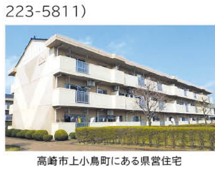
高崎市上小島町にある県営住宅

県営住宅の入居者募集 所在地・間取り・募集戸数・家賃 募集案内をご覧ください 入居資格 現在住宅に困っている人 ※収入制限などがあります ※連帯保証人は不要です ※詳しくは、募集案内または県住宅 供給公社ホームページをご覧ください 受 1月15日(土)まで 申し込み方法 所定の申込用紙 申込用紙・募集案内配布場所 県 住宅供給公社(前橋市紅雲町)、県 庁県民センター、県土木事務所、県 保健福祉事務所、市役所・町村役 場など ※県住宅供給公社では、土曜日にも配 布します 他 入居者は公開抽選で選定します ※随時申し込みを受け付けている団 地もあります。詳しくはお問い合わ せください 申・問 県住宅供給公社(☎027-