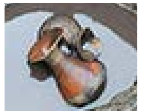
井戸の底に置かれた紅白の壺