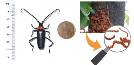
クビアカツヤカミキリの成虫(左)とフラス

問 県庁自然環境課(☎027-226-2872)、市役所・町村役場自然保護担当課