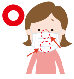
マスクをする(口・鼻を覆う)

新型コロナウイルスを含む感染症対策の基本は、手洗いとマスク着用を含む「せきエチケット」です。せきやくしゃみの飛沫にはウイルスが含まれている可能性があります。他の人への感染を防ぐため、「せきエチケット」を徹底しましょう。