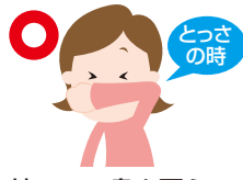
袖で口・鼻を覆う