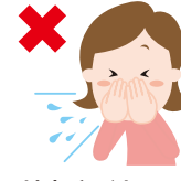
せきやくしゃみを手で押さえる