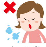
何もせずにせきやくしゃみをする