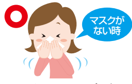
ティッシュ・ハンカチで口・鼻を覆う