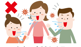
大声で会話をする