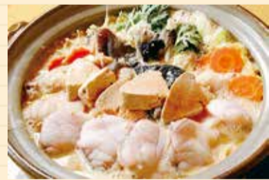
あんこうを余すところなく楽しめる鍋

茨城の冬の味覚「あんこう」。特徴的な見た目ながらさっぱりとした味わいで、コラーゲンたっぷりの白身や脂が乗った肝は絶品です。11月～3月にかけて旬を迎えるあんこうを余すところなく楽しむなら、骨以外の部位全てを美味しく味わえる鍋がおすすめ。茨城であんこう鍋を味わい、身も心も温まりませんか? 詳しくは、県公式観光情報サイト「観光いばらき」(HP参照)をご覧ください。