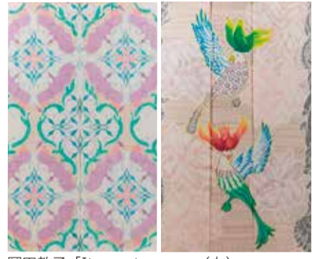
岡田教子「It creates me.」(左)、「When I am with you, I feel alive.」(右)

日本の伝統的な手拵り緋の技法に自身の機織り技術を融合した、新しい染織の世界を作り上げる岡田教子の作品を中心に紹介します。 日 11月9日(土)～12月16日(月) 午前9時30分～午後5時 休 火曜日 所 県立日本絹の里(高崎市金古町) 観覧料 一般11200円、大学・高校生11100円、中学生以下11無料 問 ☎027・360・6300