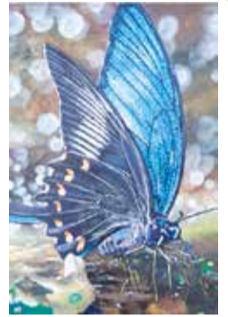
今年度金賞受賞者の作品