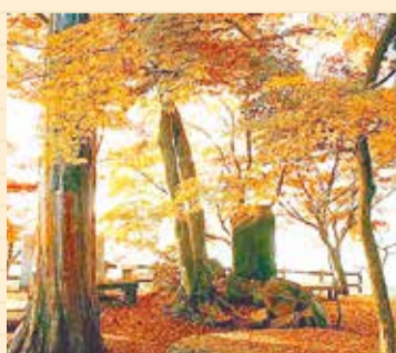
赤や黄色に色づく太平山のモミジ

蔵の街・栃木市の西に位置する太平山。赤や黄色に色づいたモミジで彩られる紅葉は見事です。山頂近くの謙信平からは関東平野が一望でき、周囲の峰々が霧に浮かぶ雄大な景観は「陸の松島」と称されるほど。秋晴れの日には、遠くに富士山や東京スカイツリーなどを見ることが出来ます。また日本夜景遺産に認定された夜の眺めも圧巻です。 11月下旬には「もみじまつり」が開催され「玉子焼き」無料体験教室や風船パフォーマンス、太平山随神太鼓など、楽しいイベントが盛りだくさん。また山頂付近の茶店では、太平山三大名物「焼き鳥・玉子焼き・だんご」が味わえます。 名物を堪能しながら、太平山の紅葉とともに秋の澄んだ空に広がる関東平野の絶景をお楽しみください。