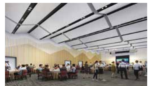
レセプション利用イメージ(大会議室)