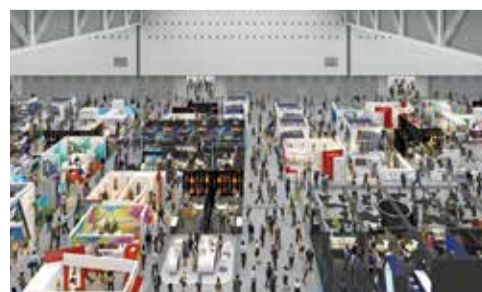
展示会利用イメージ(展示ホール)