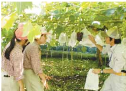
収穫体験をする参加者(花き・果樹コース)

※申込用紙は、県立農林大学校ホームページ(http://www.gunma-n.ac.jp/)から入手できます