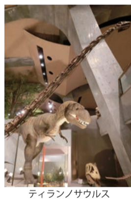
ティランノサウルス