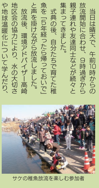
サケの稚魚放流を楽しむ参加者

式典の後、自分たちで育てた稚魚を「5年経ったら帰っておいで」と声を掛けながら放流しました。放流後、環境アドバイザー高崎地区会の協力により、水の大切さや地球温暖化について学んだり、