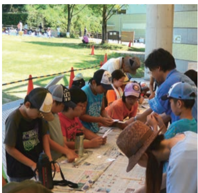
紙飛行機を作る参加者