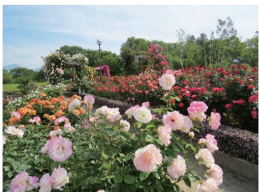
昨年のバラフェスタ

フリーダイヤル0120・1187・38 ☎027・283・8389 FAX 027・283・8389