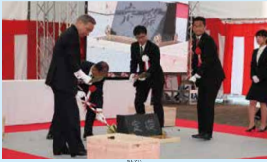
ハツ場ダム定礎式(3月4日)で鎮定の儀を行う大澤正明知事(左)

知事コラム ハツ場ダム定礎式 ダム建設の大きな節目となる、ハツ場ダムの定礎式が執り行われました。地元関係者をはじめ皆さんの尽力のたまものであり、大変うれしく思います。 ハツ場ダムは、洪水や渇水から首都圏を守る重要な社会資本です。また吾妻地域にとって、未来創生の鍵となる新たな地域資源です。 ダムの完成まで3年余りです。県では、地元の方々が安心して豊かに暮らせるよう、町や国と連携し、スピード感を持って、生活再建関連事業をしっかりと進めていきます。