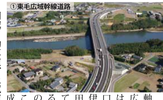
①東毛広域幹線道路

と関越自動車道、上武道路、東北自動車道がつながりました。開通前に比べ、周辺道路の渋滞緩和や沿線への工場立地の増加、物流の効率化などの効果が出ています。