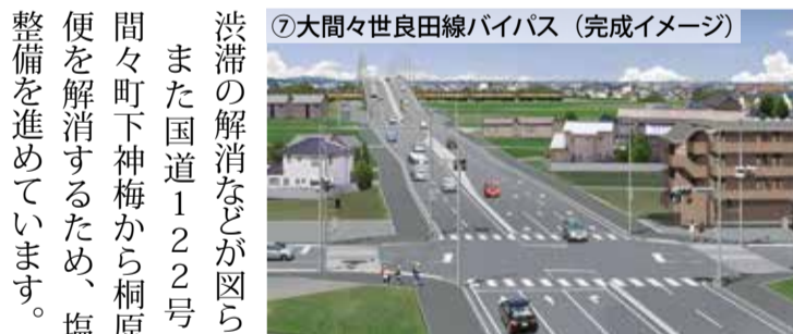
⑦大間々世良田線バイパス (完成イメージ)

また国道122号のみどり市大間々町下神梅から桐原までの交通不便を解消するため、塩原バイパスの整備を進めています。