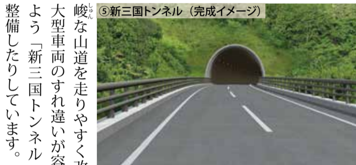
⑤新三国トンネル (完成イメージ)

場に出荷して、そのうち5割以上は首都圏向けです。23年にハツ場バイパスが開通し、渋川伊香保ICまでの所要時間が短縮されました。また路面の凹凸やカーブが少なくなったので、キャベツ同士がぶつかって傷むことが減りました。さらに雨量による交通規制がないので、出荷が天候に左右されることも少なくなりました。キャベツが安定的に供給できるようになり、とても良かったと思います。上信自動車道が全線開通すれば、収穫当日にキャベツを届けられる地域がさらに広がると期待しています。もっと多くの人に蕎麦村の新鮮なキャベツを食べてほしいですね」