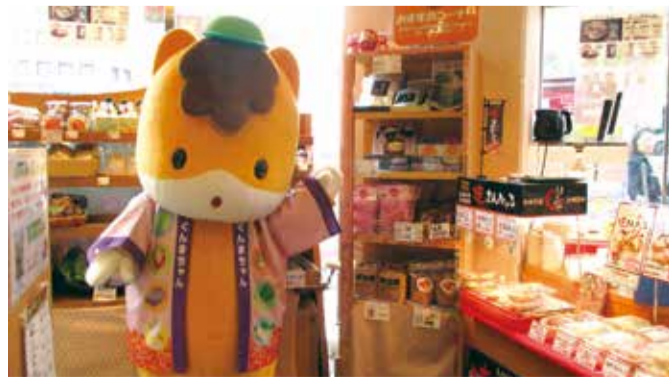
「ぐんまちゃん家」の物産販売コーナー

お知らせ 民生委員制度創設100周年 民生委員制度は、大正6年に岡山県で発足した「済世顧問制度」に始まり、今年で100周年を迎えます。済世顧問制度設置規定が大正6年5月12日に交付されたことにちなみ、5月12日を「民生委員・児童委員の日」としています。 また5月12日からの1週間を「民生委員・児童委員の日活動強化週間」と定め、民生委員・児童委員の活動をより多くの人に知ってもらうための活動を実施しています。 民生委員・児童委員とは 厚生労働大臣から委嘱を受けた特別職の公務員です。県内では、4152人の民生委員・児童委員がさまざまな活動を行っています。 活動内容は、一人暮らしの高齢者や障害のある人の家を定期的に訪問する