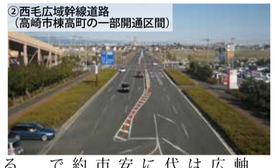
②西毛広域幹線道路 (高崎市棟高町の一部開通区間)

ら富岡までの所要時間が24分短縮される見込みです。その結果、富岡製糸場や周辺の観光地へのアクセスがスムーズになり、周遊観光客の増加などが期待できます。