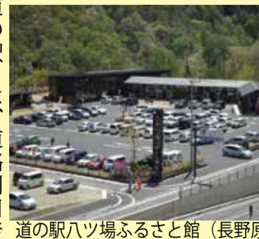
道の駅ハツ場ふるさと館 (長野原町)

「道の駅」は、道路利用者のための休憩機能、道路利用者や地域の人たちのための情報発信機能、「道の駅」をきっかけに町と町とが結びつく地域の連携機能の三つの機能を併せ持つ施設です。県内には29年4月現在で24市町村に31の「道の駅」があり、「7つの交通軸」を形成する道路沿いにも、複数の「道の駅」があります。道路利用者へのサービスだけでなく、地域の個性・魅力を生かしたさまざまな取り組みにより、地域活性化の拠点や災害時の防災拠点としての役割も期待されています。