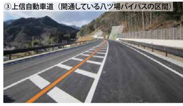
③上信自動車道 (開通しているハツ場バイパスの区間)

「道の駅」は、道路利用者のための休憩機能、道路利用者や地域の人たちのための情報発信機能、「道の駅」をきっかけに町と町とが結びつく地域の連携機能の三つの機能を併せ持つ施設です。県内には29年4月現在で24市町村に31の「道の駅」があり、「7つの交通軸」を形成する道路沿いにも、複数の「道の駅」があります。道路利用者へのサービスだけでなく、地域の個性・魅力を生かしたさまざまな取り組みにより、地域活性化の拠点や災害時の防災拠点としての役割も期待されています。〇ぐんまの道の駅ガイドマップ