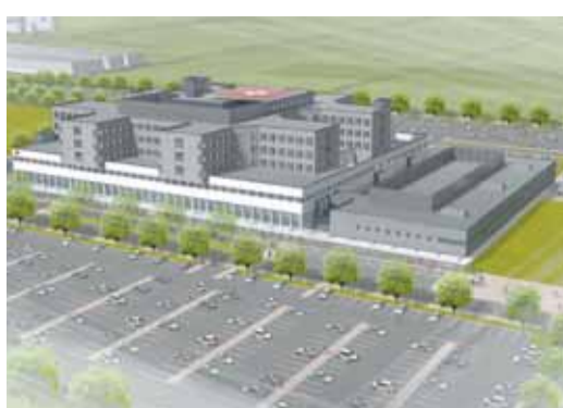
前橋赤十字病院完成予想図

12億8024万円 県内全域の高度救命救急を担う前橋赤十字病院の新築移転整備に対して補助します。工事期間：30年2月まで