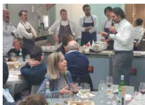
昨年イタリアで行った上州和牛とこんにやくの 프로모ーション