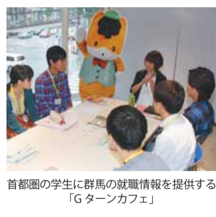
首都圏の学生に群馬の就職情報を提供する「Gターンカフェ」