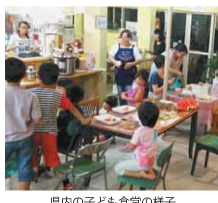
県内の子ども食堂の様子

子ども居場所の充実 新規 330万円 さまざまな理由により学習機会に恵まれない子どもたちが、学力や生活力を身に付けられるよう、民間団体が行う子ども食堂や無料学習塾の新規立ち上げなどに要する費用に対して補助します。また学習支援活動などのボランティア人材バンクを構築・運営します。