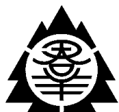
県 紋 章