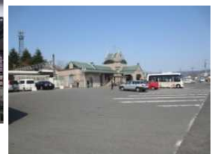
駅前広場整備 東武桐生線：新桐生駅（桐生市）