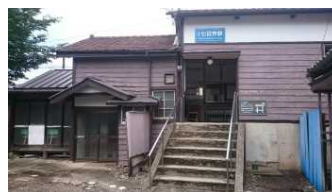
ステーション整備 上信電鉄 上州七日市駅（富岡市）