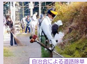
自治会による道路除草