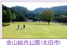
金山総合公園(太田市)