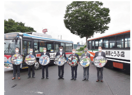
⑤公共交通と連携したアニメツーリズム事業