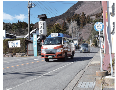
①伊香保温泉街と水沢地区を巡回するタウンバス

バスマップ等の情報発信の充実、高齢者の免許返納率の向上につながる施策の検討、バス・鉄道・タクシーの利用促進イベントやキャンペーン企画の実施に取り組みます(写真④⑤)