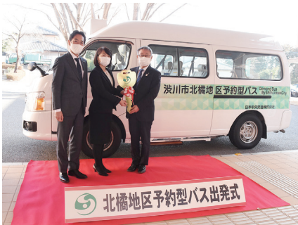
③予約型バス(試行)出発式

本計画に掲げる達成状況を毎年度評価し、施策の改善に活用することで、効率的に事業を進めていきます。また、利用者や交通事業者等と広く意見交換を行いながら、渋川市にふさわしい新たな公共交通体系の構築を推進します。