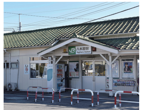
②整備計画が進むJR八木原駅