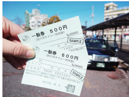
④運転免許証を持たない高齢者が利用できるタクシー券