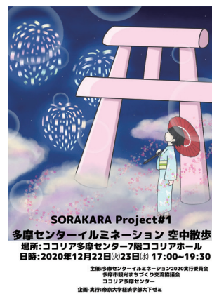
「ゆめかわ×和」のテーマをイメージ化した集客ポスター。鳥居・花火・和傘等を会場に配置しました!