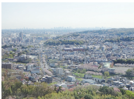
21階建・帝京大学のタワーからの眺望も、恰好のSORAKARA風景。都庁やスカイツリー、眼下には満開の桜が眺められます。