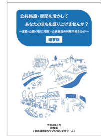
利用手続きガイドの表紙