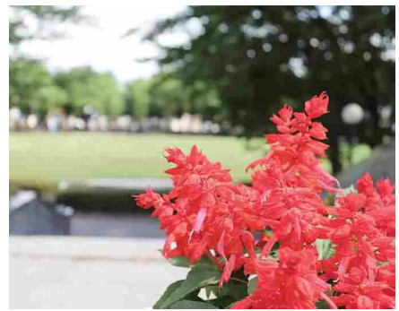
桐生市の花 サルビア

メイン花壇については、単に土に直接花苗を植え付けるというわけではなく、ある程度の大きさのトレーの中で花苗を育成させ、そのトレーごと現地に設置する手法を採用しました。そうすることにより、ボランティアの方による花植えの際に作業が容易であるとともに、花壇撤去時にはトレーごと移設可能なため、他の場所での再利用促進にもつながり、桐生市が掲げている持続可能なまちづくりに通ずる取組となっております。