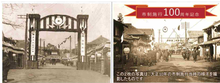
大正10年の市制施行当時の様子