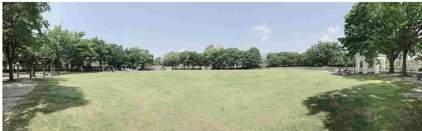
メイン会場 新川公園