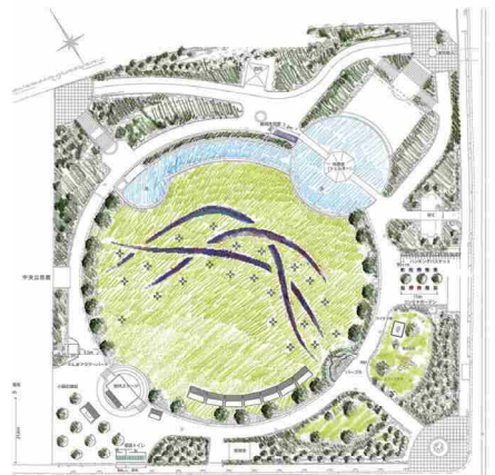
メイン花壇ラフスケッチ ©橋内庭園設計