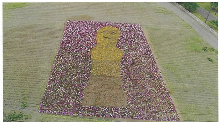
笑う埴輪の地上絵