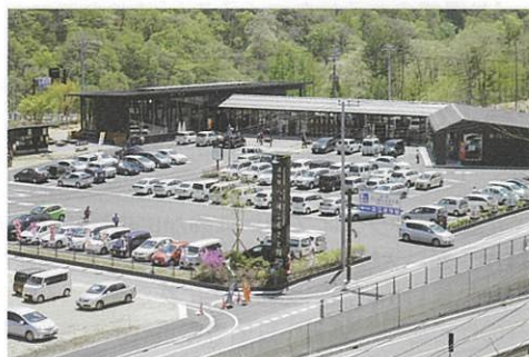
観光客で賑わう「道の駅ハッ場ふるさと館」