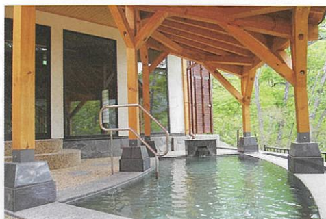
川原湯温泉「王湯」の露天風呂