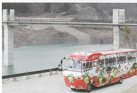
水陸両用バス「ハッ場にゃがてん号」