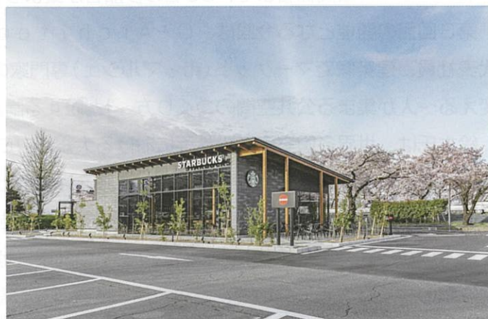
スターバックス コーヒー 敷島公園店(外観)

敷島公園の自然、環境、風景に溶け込むように、国内のスターバックスでは稀な木造建築が採用されており、店内のコミュニティテーブルには県産材を用いた「JIMOTO table」を設置したり、群馬県出身アーティストによる上毛三山をモチーフとした作品を掲示するなど、「公園」「文化」「地域」とのつながりを意識したデザインとなっています。