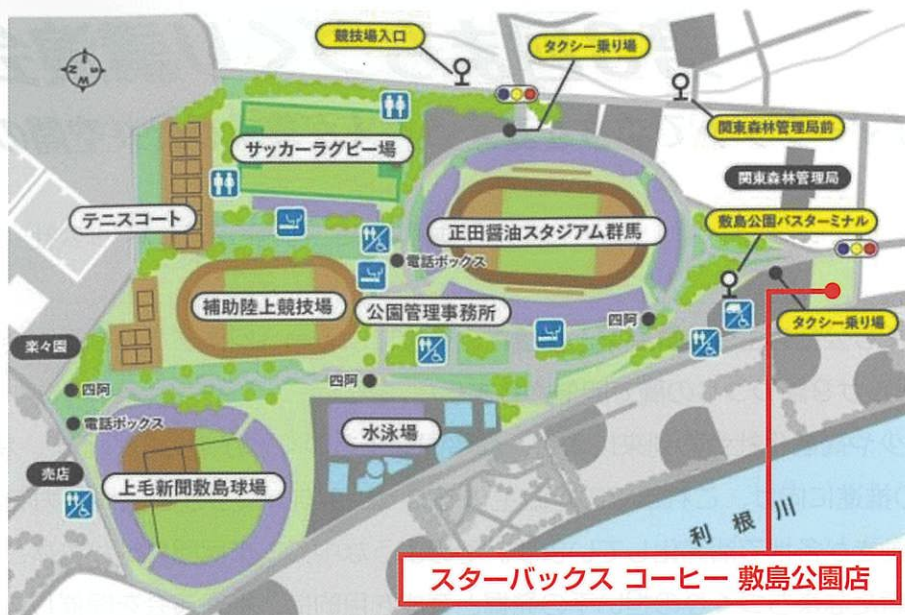
スターバックス コーヒー 敷島公園店