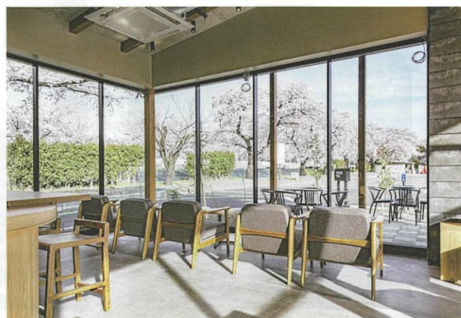
店内から眺望する桜