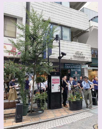
横浜市内での現地講義

研修の後半には今後の景観に関する課題について、グループ討議を行いました。ああでもない、こうでもないと考えをぶつけ合い、中身の濃い討論を行うことができました。最後に各グループの発表がありましたが、完成度の高い発表ばかりで、全体を通して様々な刺激を受けながら景観について学ぶことができました。