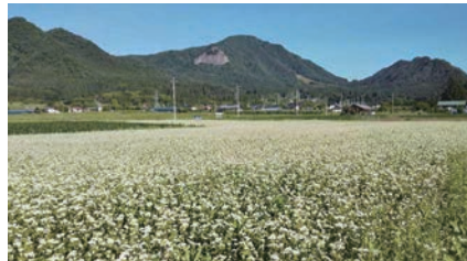
里山に広がる秋そばの花