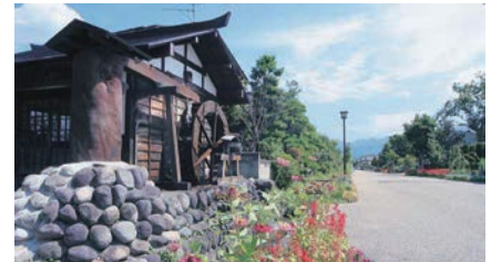
華やかな宿場通り