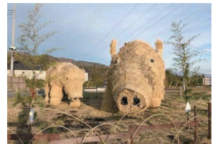
今年の干支「イノシシ」のワラアート