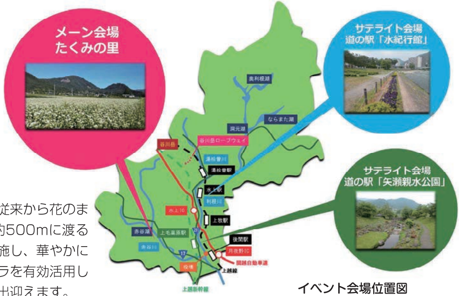
イベント会場位置図

宿場通り沿いでは、地元住民が従来から花のまちづくりを目指し活動している約500mに渡る既存花壇に変化を持たせた飾花を施し、華やかに演出します。また、地元で出るワラを有効活用した迫力あるワラアートが来場者を迎えます。