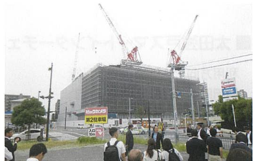
高崎芸術劇場(建設中)