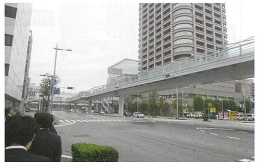
高崎駅から芸術劇場まで伸びるペDESTリアンデッキ(建設中)