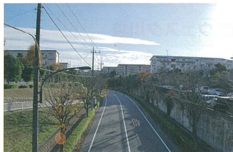
市内に架かる「ふんすい橋」からの眺め。歩車分離で整備された安心・安全できれいな街並みです。

高度経済成長期をくらしの面で支えた「多摩ニュータウン」とともに成長してきた人口約15万人(2017年現在)のまち・多摩市。京王線、小田急線、多摩都市モノレールが通っており利便性が高く、東洋経済新報社の「住みよさランキング2015」の総合評価でも、都内の市区町村で3位(関東で15位)と上位にランクインしています。「多摩ニュータウン」の整備から約40年、入居者の高齢化の問題もあり、来街者を誘致する取り組みによってまちに活気をもたらすことが課題となっています。