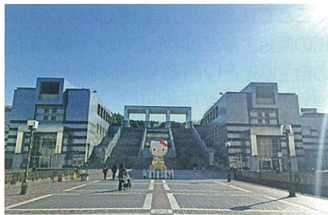
文化芸術の中心地パルテノン多摩前にも期間限定でキティちゃんがお目見え！

多摩市を代表する施設といえば、ギリシャのパルテノン神殿をモチーフとした複合文化観光施設「パルテノン多摩」があります。1987年から多摩市のシンボルとして存在してきたパルテノン多摩も、施設や設備の老朽化が目立つようになり、大規模改修が予定されています。新しく綺麗に生まれ変わるパルテノン多摩が、多摩市の文化芸術振興の中心となっていくことを願っています。