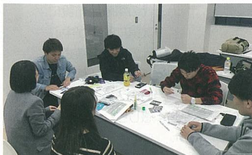
ゼミの時間に「橋」の現地調査の結果を振り返りながら「よそ者・若者ワークショップ」の準備中！

キャラクターやアニメを活用した「シティプロモーション」、生まれ変わる「パルテノン多摩」を中心にした文化芸術の振興、そして周辺の緑や身近な自然を含めた「橋」が新たな魅力として加わることにより、多摩市が、新宿から高尾山まで行かなくても気軽に楽しめる場所となれば良いと願っています。