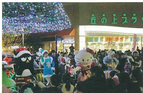
12/1に多摩センター駅近くで開催された「ハローキティにあえる街イルミネーションスペシャルパレード」は大盛況！

多摩市が力を入れているのが「シティプロモーション」。2003年にハローキティを「多摩センター親善大使」に任命し、多摩センター地区を「ハローキティにあえる街」と制定しました。サンリオのキャラクターのラッピングバスや、キャラクターを起用した案内板の設置などの取り組みのほか、なんと「ハローキティの絵柄入り住民票」の交付！まで行っています。また、市内にはアニメ映画「耳をすませば」のモデルとされる道や、「仮面ライダー」をはじめとした特撮ヒーローものや、ドラマや映画のロケ地としても頻繁に登場します。