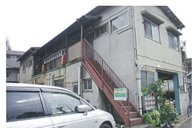
大田区には町工場がたくさんあります