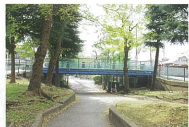
水は流れていないのに橋が!