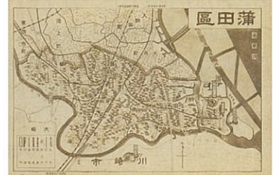
旧大森区の地図(上)と旧蒲田区の地図