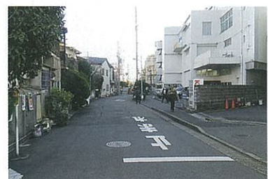
写真右側の歩道を六郷用水が流れていたようです