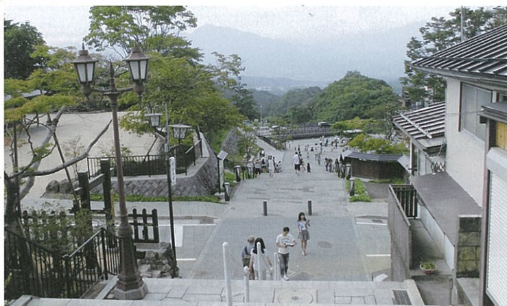
写真 整備後の状況 (石段方面から渋川松井田線を望む)