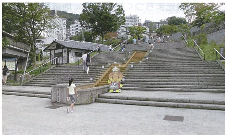
写真 石段の中央に設置したカスケード