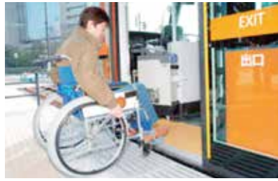
図3 車いすでのスムーズな乗降 (富山ライトレール)

LRTの車両は、その高いデザイン性から「まちのシンボル」としての役割も期待されており、今後、車両の外観や車体カラーの選定にあたっては「宇都宮らしさ」が発揮されるよう検討を進めていきます。