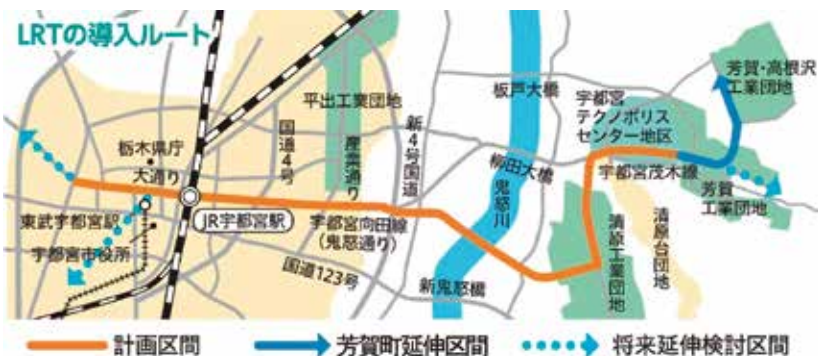
図2 LRT導入区間及びルート図

また、平成25年10月に、隣接する芳賀町から、LRT計画に参画したいとの要望があり、多くの従業者を有する芳賀・高根沢工業団地までの町域区間約3kmを加えた計15kmについて、町とともに一体的に整備を進めていくこととしています。