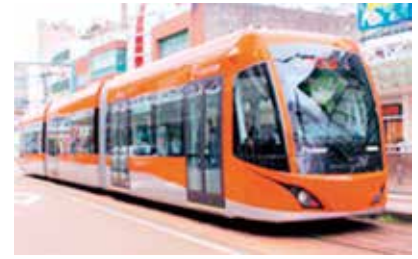
図4 低床式車両の例 (福井鉄道 F1000形)