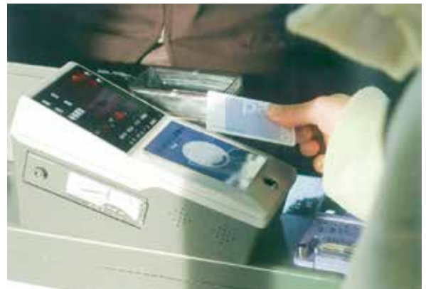
図5 ICカードを用いた乗降例 (富山ライトレール)

具体的には、鉄道、LRT、バスなどの乗り継ぎ利用をはじめ、電子マネーの機能拡充や行政サービスとの連携など、さまざまな活用の可能性を含め、交通事業者と連携を図りながら、本市にふさわしいICカードシステムのあり方について検討を行っています。