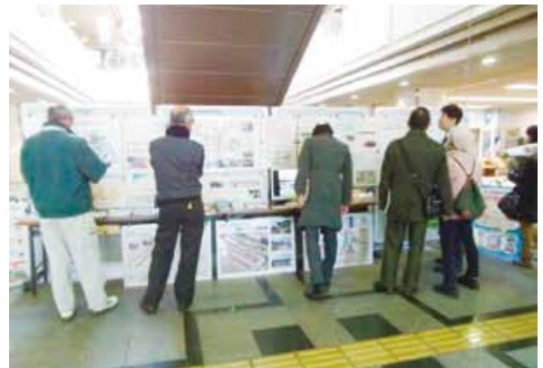
図6 オープンハウス開催の様子

具体的な取り組みとしては、「利便性の高い公共交通ネットワークや基幹となるLRT整備の必要性」、「LRT事業の概要」、さらには「最新の取組状況」などについての説明やパネルの展示、職員との意見交換などを行う「オープンハウス」を出先機関やショッピングセンター等において開催するとともに、説明会の実施や市の広報紙を活用した情報提供を行うなど、分かりやすく丁寧な説明に努めています。