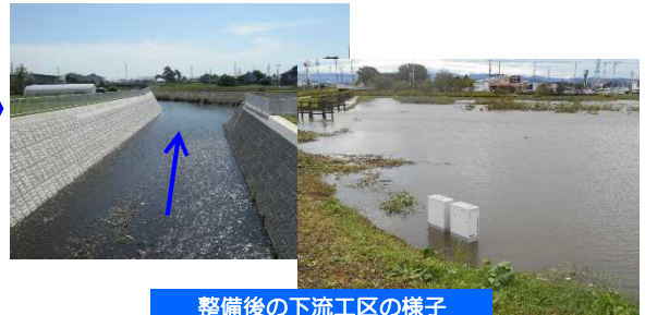
整備後の下流工区の様子

◆川幅を拡げ、流せる水量を増やすとともに、調節池に水を貯めることにより下流へ流れ込む水の量を減らし、河川の氾濫による被害のリスクを軽減します。