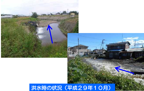
洪水時の状況 (平成29年10月)

◆大雨の時、水が一度に小さい河道に流れ込むため、河川が氾濫しました。(平成29年10月)