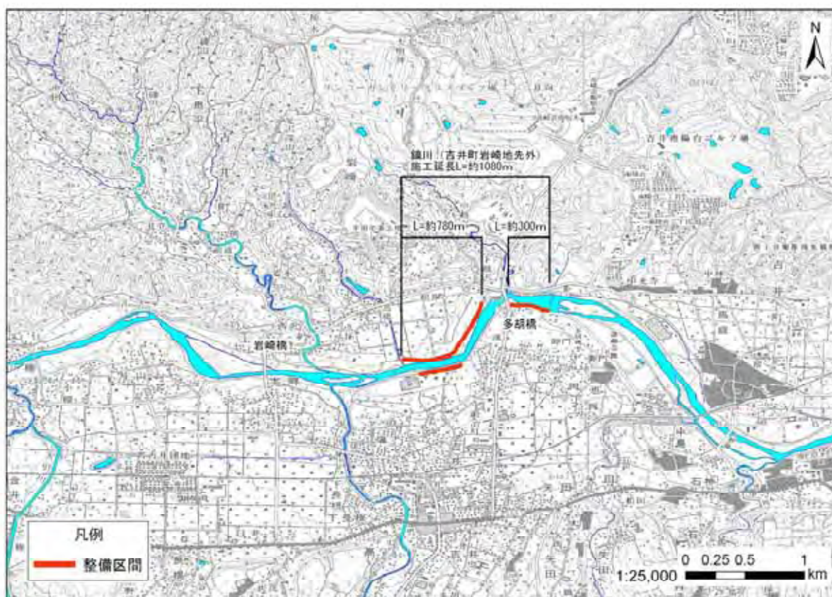
平 面 図