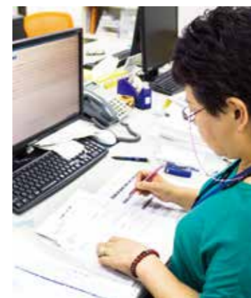
■納品書チェック センターに到着した商品、各店舗へ発送した商品の納品書のチェックを行います。