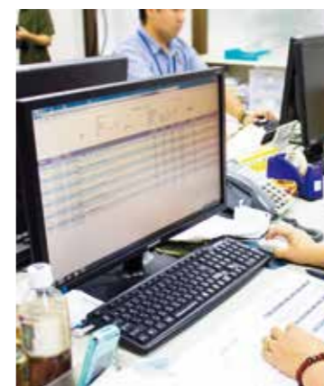
■精算書入力 専用のソフトを使いパソコンで入力作業を行います。