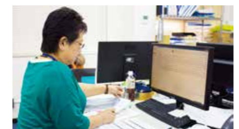
■伝票チェック 伝票を1枚1枚手作業でチェックを行い、パソコンを使ってデータを反映させます。