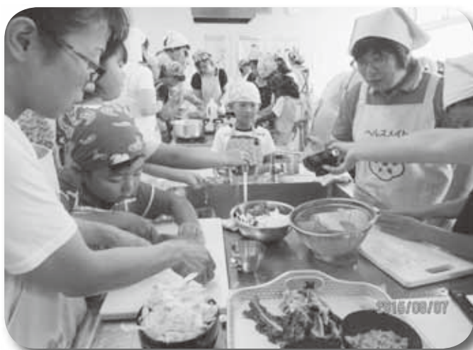
おやこの食育教室