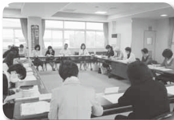
地域食育推進ネットワーク会議