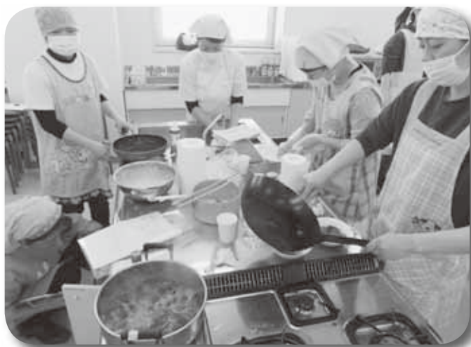
保育所などの給食担当職員研修会