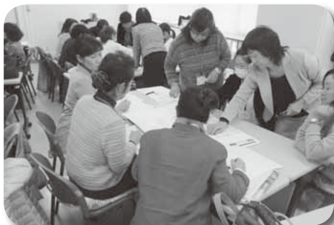
食育推進リーダー研修会