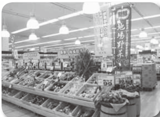
ぐんま地産地消推進店