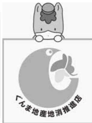
ぐんま地産地消シンボルマーク