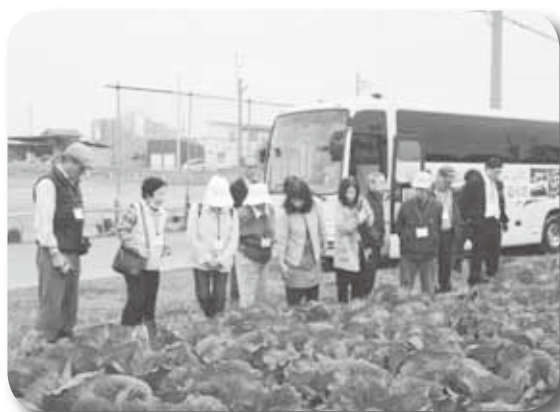
食の現場公開事業