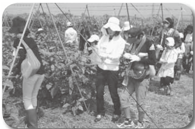
親子の野菜収穫体験