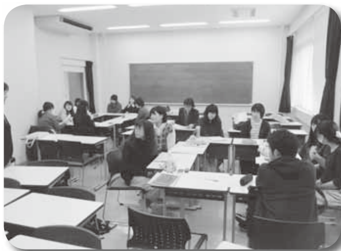
大学生の食に関するグループインタビュー