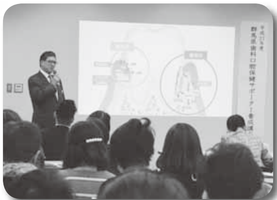
歯科口腔保健対策事業