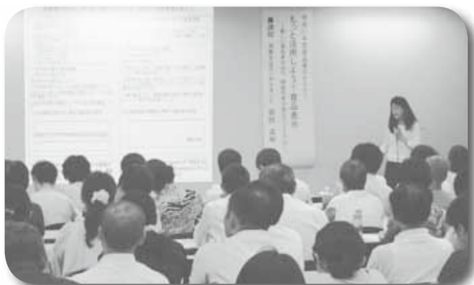
リスクコミュニケーション事業