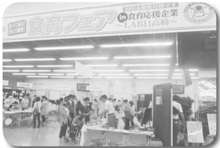
食育応援企業との食育イベント