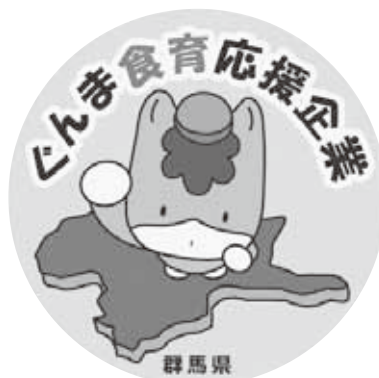
ぐんま食育応援企業ロゴマーク