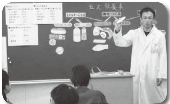
学校における食育