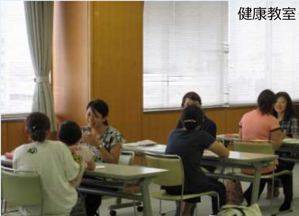
健康教室・指導風景